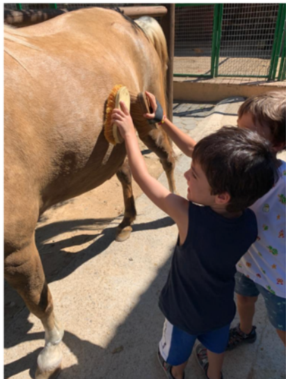
Els infants d'infantil hem començat la setmana amb molta ENERGY i ganes d'aprendre coses noves!

Amb petites explicacions i peus de pàgina perquè sapigueu què es fa en cada activitat!