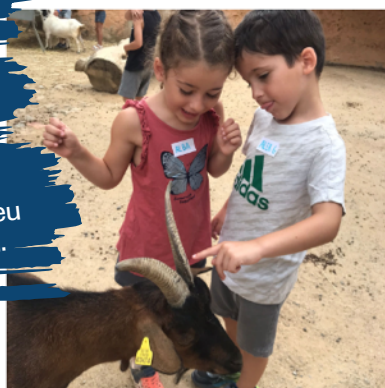
Ready, steady... GO! Donem el tret de sortida a la primera setmana del casal passant-nos-ho d'allò més bé!

BLOG del CASAL A l'estiu, activem un blog per a cada casal Happy English, que actualitzem regularment perquè pugueu fer un seguiment del casal.