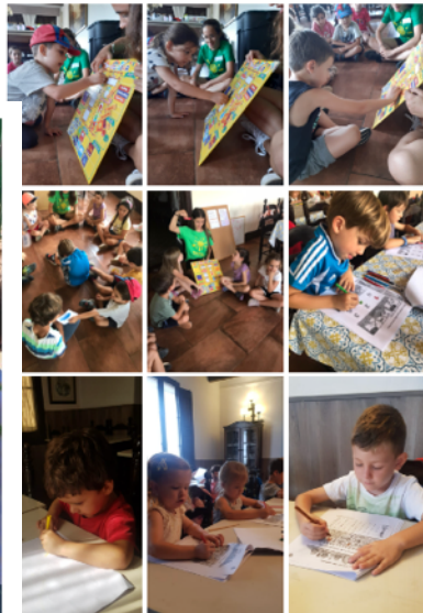
¡No! hem fet jocs de descoberta... TREASURE HUNT! i altres dinàmiques molt divertides per éixer fespall i els companyis!