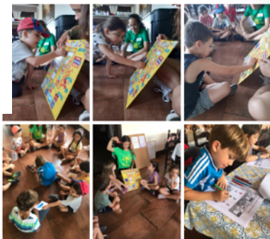
També hem fet jocs de descoberta... TREASURE HUNT! I altres dinàmiques molt divertides per conèixer l'espai i els companys!