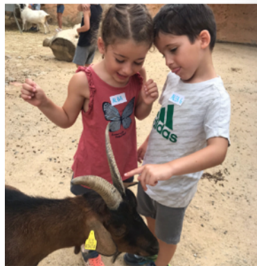
Steady... GO! Donem el tret de sortida a la primera setmana del casal passant-nos-ho lú més bé!