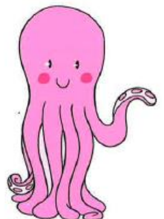
Otto the octopus